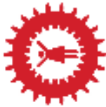
TABELLA n. 2: SETTORI PRODUTTIVI RAGGRUPPATI NELLE TRE TIPOLOGIE AGRICOLTURA, INDUSTRIA E SERVIZI: